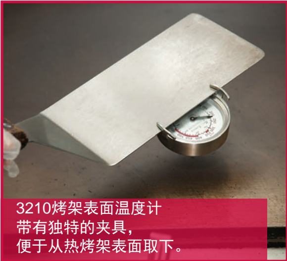
3210烤架表面温度计 带有独特的夹具， 便于从热烤架表面取下。