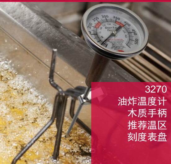
3270 油炸温度计 木质手柄 推荐温区 刻度表盘